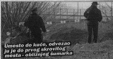
Umesto do kuće, odveo ju je do prvog skrovitog mesta - obližnjeg šumarka