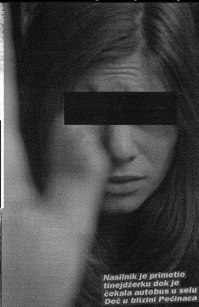
Nasilnik je primetio tinejdžerku dok je čekala autobus u selu Deča u blizini Pećinaca